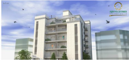
"המנהל אינו עונה"

יוקרה בכף ידך בנין בוטיק עם דירות ענק פרלשטיין 8, בת-ים סטטוס: עבודות גמר !!!